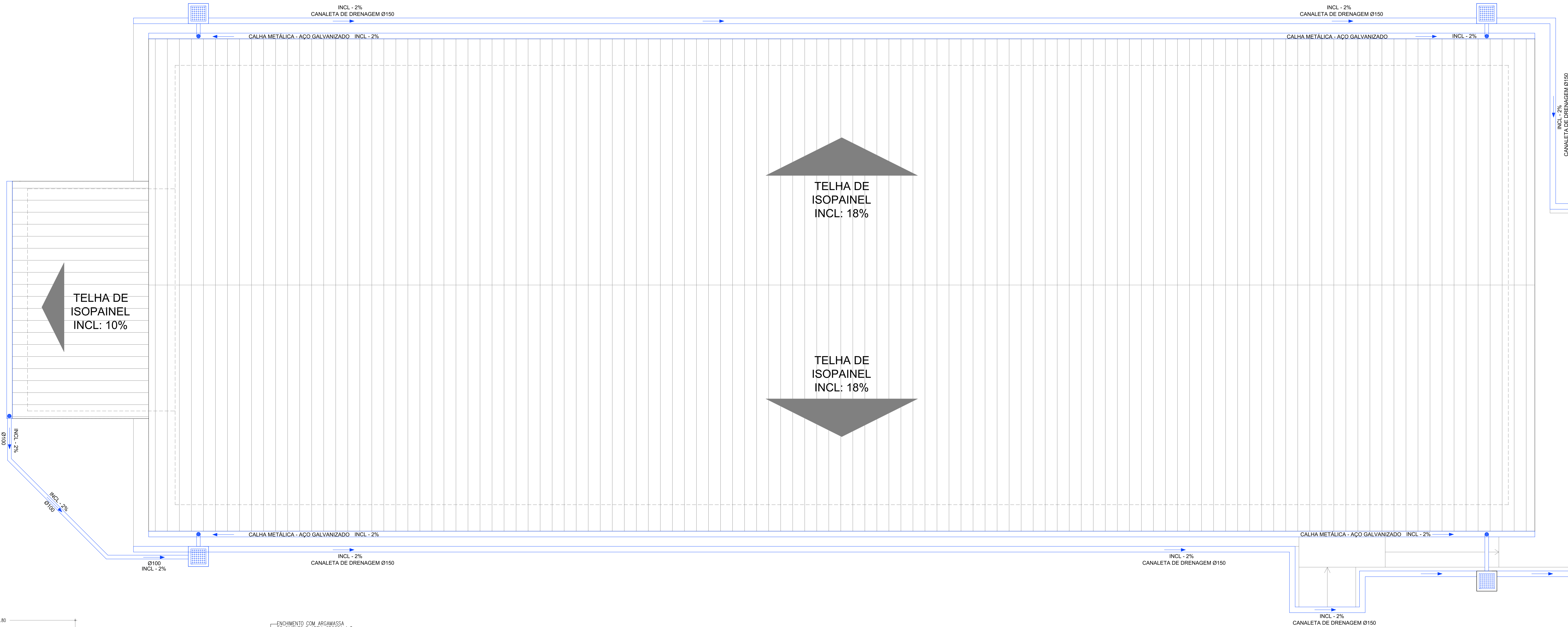
PLANTA DE DRENAGEM PLUVIAL ESC: 1/50